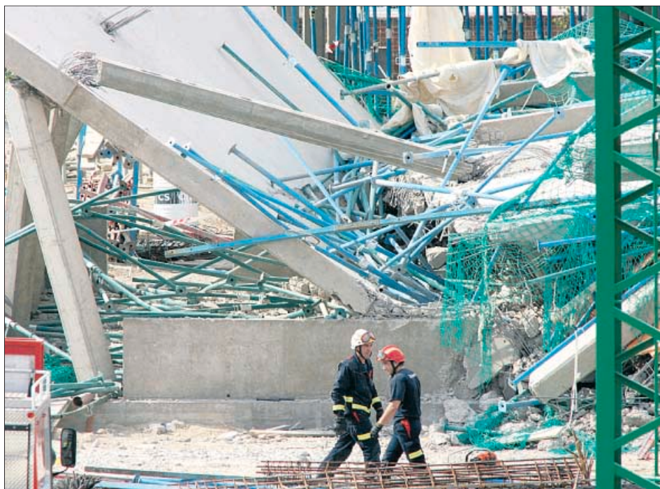
Aspecto del edificio que se derrumbó ayer, lo que causó la muerte de dos trabajadores.

Rowen y Plácido quedaron sepultados bajo los escombros: los bomberos y las unidades caninas de la Policía y la Guardia Civil tardaron más de dos horas en encontrarlos. Los servicios de Emergencias intentaron contactar telefónicamente con ellos: entre los cascotes se escuchaba el sonido de una llamada, pero nadie contestaba. Los cuerpos fueron hallados a las 18.20 horas. Los sanitarios sólo pudieron certificar su muerte.